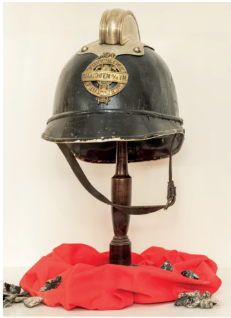
Feuerwehrhelm in der Dauerausstellung des Stadtmuseums

Schicksal traf die Stadt am 7. August 1873. Aus ungeklärter Ursache brach in den Stallungen des Gasthauses „Zum goldenen Löwen“ um die Mittagszeit Feuer aus. Das Feuer griff auf den Dachboden des Wohngebäudes über, auf dem große Mengen Schmalz gelagert waren, wodurch auch dieses Feuer fing. Durch den Wasserstrahl der Spritzen flogen brennende Schmalzkugeln in alle Richtungen davon. Der starke Wind von Westen trug diese in die Stadt und setzte die größtenteils