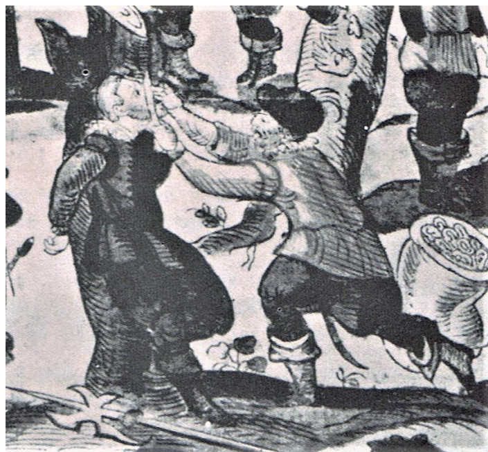
Bestrafung der aufständigschen niederösterreichischen Bauern 1597

März 1597 ganz lapidar: „Item hat man den 21. drei Pauren vor dem Rathaus die Ohren abgeschnitten“.