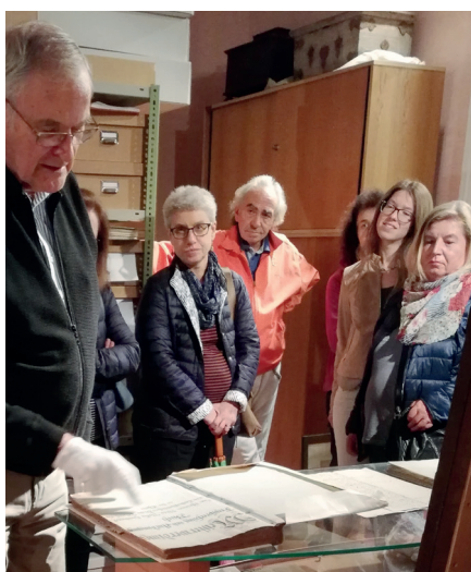
Spazierung durch das Archiv

Thema Weberei. Dabei kam er so richtig in Fahrt, und während des Erzählens purzelten die Geschichten und vielen wertvollen Informationen nur so aus ihm heraus. Wie man sieht, war das Publikum mit voller Aufmerksamkeit bei ihm und hing an seinen Lippen.