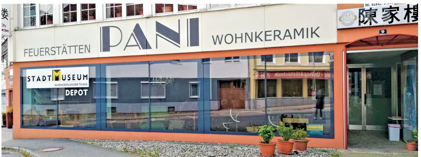
Depot des Stadtmuseums in der Heidenreichsteinerstraße 9

Edith Monaco 02842 53 401 info@stadtmuseum-wt.at