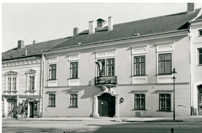
Ehemalige Bezirkshauptmannschaft am Hauptplatz 9

Die Stadt verlor in diesem Jahr ihren Magistrat, ihre Güter, das Landgericht innerhalb der Stadtmauern, die obrigkeitlichen Rechte über die Stadt, die Vorstädte und über ihre Holden in Hausbach, Kainraths, Klein Erberharts, Plessberg, Obergrünbach, Albern-dorf und Seeps sowie in Zellerndorf im Weinviertel. Dafür erhielt die Stadt die Selbstverwaltung, die Verwaltung ihres Vermögens, Ortspolizei, das Volksschulwesen und die Armenpflege anvertraut.