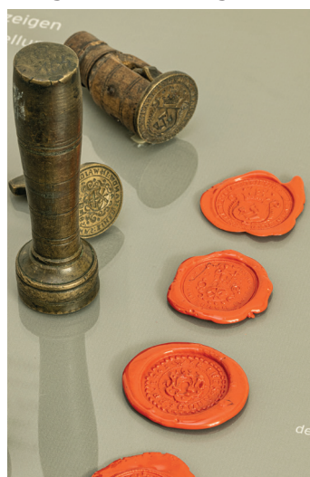
Zunftsigel in der Dauer- ausstellung des Stadt- museums

Die Handwerker waren bis zur Erlassung der Gewerbeordnung im Jahr 1859 in Zünften organisiert. Diese umfassten das gesamte bürgerliche und religiöse Leben ihrer Mitglieder und deren Angehörigen. Durch Zunftordnungen oder sogenannte „Artikel“ wurden die Erzeugung, der Verkauf der Handwerksartikel und die Dienstleistungen der Handwerker geregelt. Die Zünfte übten auch soziale Funktionen für ihre Mitglieder aus. Ebenso waren Vorschriften zur Religionsausübung in den Zunftordnungen enthalten.