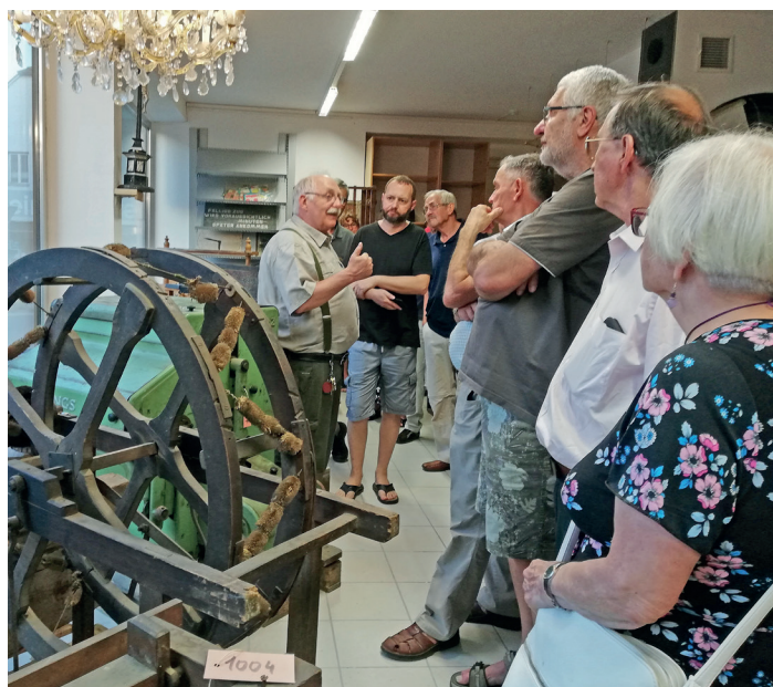
Spazierung durch das Depot

Thema Weberei. Dabei kam er so richtig in Fahrt, und während des Erzählens purzelten die Geschichten und vielen wertvollen Informationen nur so aus ihm heraus. Wie man sieht, war das Publikum mit voller Aufmerksamkeit bei ihm und hing an seinen Lippen.