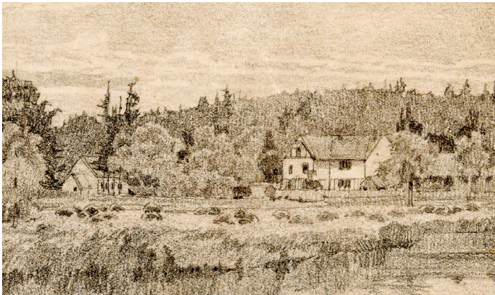
Sixmühle Ausschnitt aus einer Radierung von Karl Hoefner