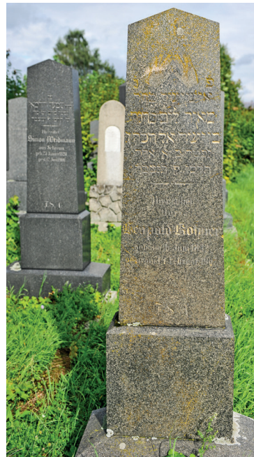
Jüdischer Friedhof 2010