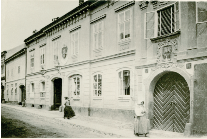
Ehemalige Post 1894

Vor der Eröffnung des Postamtes musste die Post über das schon bestehende Postamt Schwarzenau abgeleitet werden.